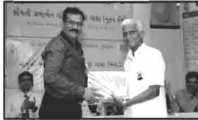
સ્વાવલંબી ગામ નંદાસર ના દાતાશ્રીનું સન્માન