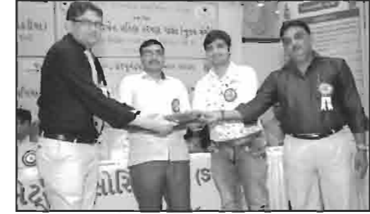
શ્રી ગાગોદર યુવા મંચ