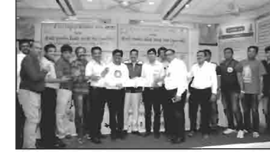
શ્રી લાકડીયા યુવક મંડળ, મુંબઈ