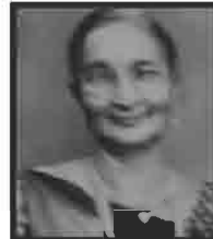
શ્રીમતી જમાણાબેન ગાંગજી વેરશી સત્રા પરિવાર