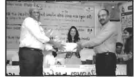
સ્વાવલંબી ગામ રવ ના સંયુક્ત દાતાશ્રીઓનું સન્માન