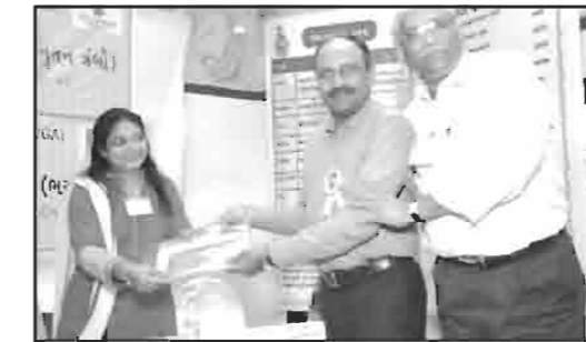
શ્રી રવ વિશા ઓશવાળ મિત્ર મંડળ, મુંબઈ