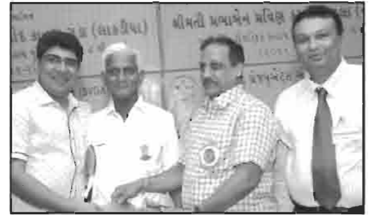
શ્રી નંદાસર વિશા ઓશવાળ મિત્ર મંડળ