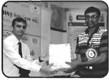
માતૃશ્રી કુંવરબેન ભારમલ ખેતશી નિસર નું સન્માન