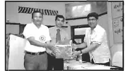
સ્વાવલંબી ગામ કકરવા ના દાતાશ્રીનું સન્માન

~ વર્ષ ૨૦૧૬-૨૦૧૭ ના સ્વાવલંબી ગામના દાતાશ્રીઓ ~