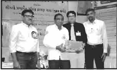
સ્વાવલંબી ગામ ભચાઉ ના સંયુક્ત દાતાશ્રીઓનું સન્માન

SVGA સંચાલિત શૈક્ષણિક સહાય યોજના (વર્ષ - ૧૦) ચેક વિતરણ સમારોહ દરમિયાન હાજર રહેલા સર્વ સ્વાવલંબી ગામના દાતાશ્રીઓનો ખૂબ ખૂબ આભાર !