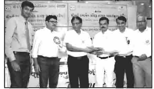
શ્રીયુત મિત્ર મંડળ (ભચાઉ) મુંબઈ