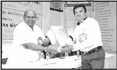
સ્વાવલંબી ગામ ઘાણીથર ના દાતાશ્રીનું સન્માન