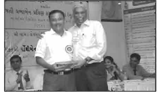
શ્રીયુત કકરવા વિશા ઓશવાળ મિત્ર મંડળ