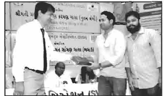
શ્રી સુવઈ વિશા ઓશવાળ જૈન મિત્ર મંડળ,