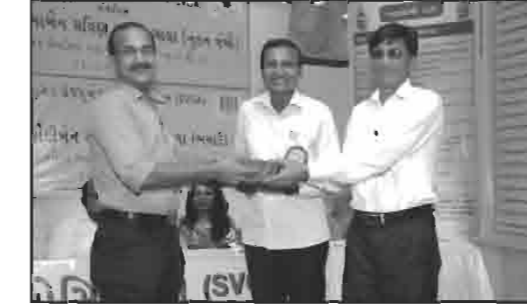
શ્રી ઘાણીથર શ્વેતામ્બર મૂર્તીપૂજક જૈન સંઘ