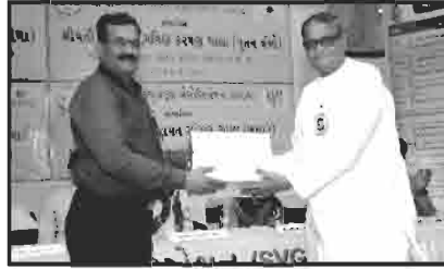
સ્વાવલંબી ગામ નુતન ત્રંબૌ ના દાતાશ્રીનું સન્માન