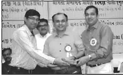
શ્રી મનફરા યુવક મંડળ, મુંબઈ